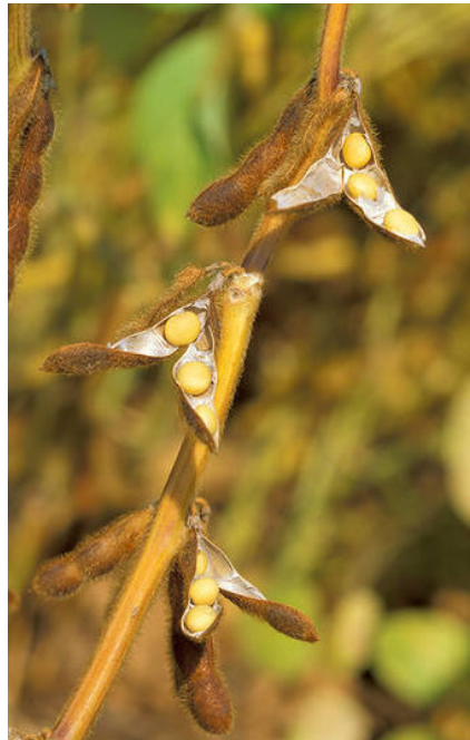
Granos de soya

Es necesario que le perdamos el miedo a la carne, leche, jugos, postres y otros alimentos hechos con este ingrediente, el sabor ha mejorado y gracias a ello, su aparición en los supermercados es mayor, ya que no sólo se encuentran en tiendas naturistas. Así es que no dejes pasar más tiempo y empieza a probar la soya en sus diferentes presentaciones y lo mejor, sentir sus beneficios.